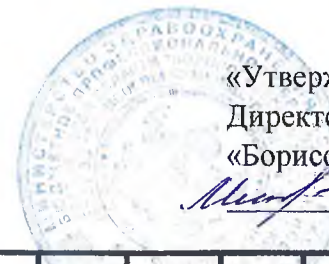
ГРАФИК УЧЕБНОГО ПРОЦЕССА 1 курс 11 фм 33.02.01 Фармация (ФГОС 2022 г.) 1 полугодие 2024 – 2025 уч. г. 17 недель (1 семестр)