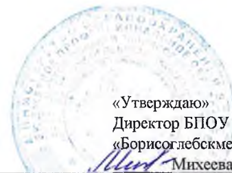
ГРАФИК УЧЕБНОГО ПРОЦЕССА 3 курс ; 221 фм 33.02.01 Фармация (ФГОС 2021 г.) 2 полугодие 2024 – 2025 уч. г. 9,5 недель/ 3 нед УП/ 3 нед ПП/ 1,5 ПА / 4 нед ПСП (6 семестр)

«Утверждаю» Директор БПОУ ВО «Борисоглебскмедколледж» Михеева Л.В.