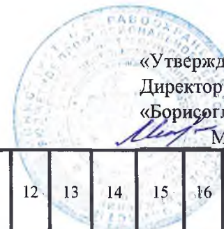
ГРАФИК УЧЕБНОГО ПРОЦЕССА 2 курс 21 фм ; 121 фм 33.02.01 Фармация ( ФГОС 2021 г.) 1 полугодие 2024 – 2025 уч. г. 16,5 недель (3 семестр) 0,5 ПА

«Утверждаю» Директор БПОУ ВО «Борисоглебскмедколледж» Михеева Л.В.