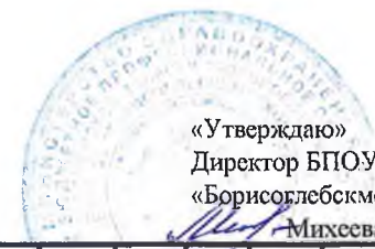
ГРАФИК УЧЕБНОГО ПРОЦЕССА 3 курс 221 фм 33.02.01 Фармация (ФГОС 2021 г.) 1 полугодие 2024 – 2025 уч. г. 11,5 недель / 1 нед УП/ 4 нед ПП/ 0,5 недПА (5 семестр)

«Утверждаю» Директор БПОУ ВО «Борисоглебскмедколледж» Михеева Л.В.